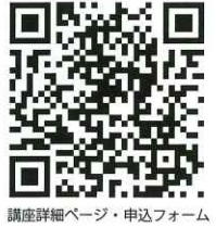
講座詳細ページ・申込フォーム

開催日時 令和8年3月14日(土) 9時~12時30分 開催場所 有限会社森下林業春日山林 講座内容 林業の現場を訪問し、植栽を体験します。関係者から話を聞くことを通して、三重県の森林や林業への知識を深めます。 定員 15名