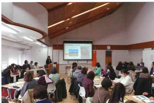
幼児教育・保育セクション