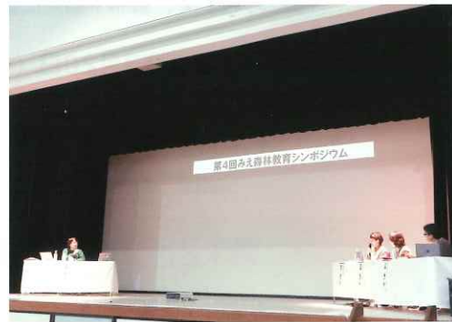
ステージイベント（トークセッション）

みえ森林教育の推進に向け、森や木に触れる機会とより深い学びを提供するために私たちができることについて考えるとともに、関係者のネットワークを構築し、それらの活動の一層の展開を図る場として、1月31日（土）に「第4回みえ森林教育シンポジウム」をスズカト（三重県立鈴鹿青少年センター）で開催しました。