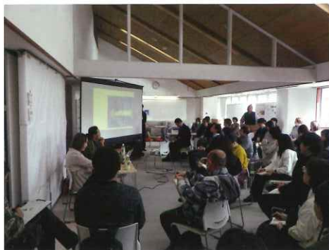
学校教育セクション