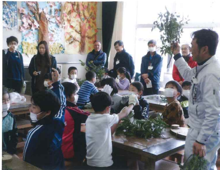
受講生が森のせんせいの出前授業を後ろで見学している様子（午前）

1月17日（金）に玉城町立下外城田小学校と玉城町保健福祉会館にて講座を開催しました。