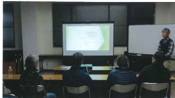
森のせんせいの体験談を聞いている様子（午後）

その後に午前と午後の森のせんせい2人を囲んでディスカッションを行い、受講生の皆さんは疑問に思っていることを問いかけて今日から学び得られたことを日頃の活動に取り入れたいという様子でした。