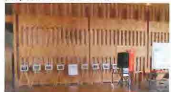
熊野古道センターでの展示の様子

8/2(月)～8/6(金)はイオンモール四日市北店で、8/16(月)～8/18(水)はイオンタウン伊勢ラパークで開催しました。