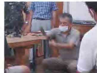
昨年度の講座の様子

木や木材に親しみを持ち、私たちの暮らしや経済の中に、当たり前木材が使われるようになることの意義を学び、木で創作する心地良さを体験し、意義や木の良さを伝えることを考えます。