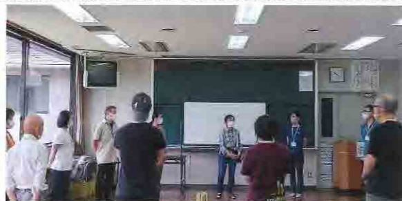
左から順に、「知識編」「野外活動安全管理編」「技術編」の様子

6月27日(日)石水溪と池山公民館にて、「知識編」講座を開催しました。この講座では、指導者の基礎知識として、森林の多面的機能や林業とその課題について学びました。実地での森や川の様子、治山ダムなどの見学では、石水溪の特徴である花崗岩についての説明もあり、地上のことを知るためには、地面の下の地質のことを知ることも学びました。