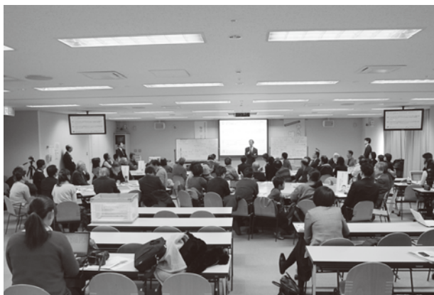
平成23年度の会議の様子

今回の「博物館会議」は、新県立博物館開設に向けた取り組みの進捗状況について、県民のみなさんに報告し、オープンな意見交換を行い、アイデアなどを出し合い交流する場として平成21年度から開催しています。ぜひ、これを機会に博物館づくりにご参加ください。