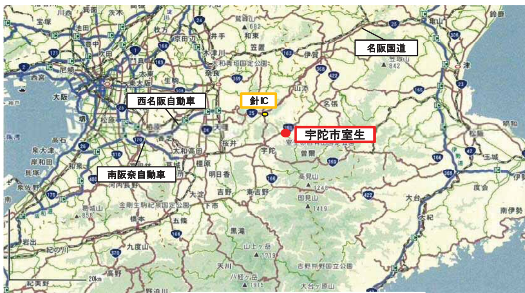
高速道路・国道と宇陀市室生の関係