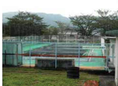
オオサンショウウオ保護施設

〒518-0737 三重県名張市安部田2270番地 TEL 0595-64-7890