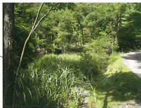
モリアオガエルの池

5月中旬頃からモリアオガエルが次々と卵 を産みます。多いときは卵塊が100コ以上 にもなります。カエルをねらってシマヘビ やアオダイショウが待ちかまえる。孵化した オタマジャクシを食べようと、イモリやヤ ゴが泳いでいます。夏にはオオルリボシヤ ンマが産卵のため飛び交う姿も見られます。 ヒルムシロが水面を覆い、ハンノキが自生 し、小さな池ですがさまざまな生きものの 世界が広がっています。