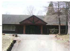
自然研修センター

くつきの森の事務所です。宿泊の部屋やホール などの施設もありますので、合宿や研修などに 向いています。トイレもあります。お気軽にお 立ち寄り下さい。