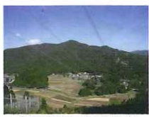
南山から見た行者山 (中央分水嶺)